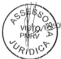
Lauriny Ferreira Alves Secretária Municipal de Saúde