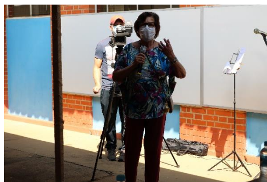
Conselheira Madalena, 21/09/21, foto: Maria Ap. Campos Rodrigues