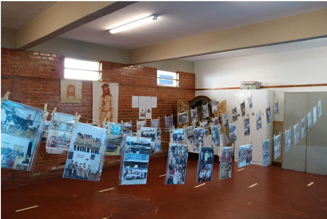
Exposição Fotográfica para conhecimento e pesquisa, 21/09/21, foto: Maria Ap. Campos Rodrigues

Quadro III C – Programas de Educação para o Patrimônio e Ações para Difusão Conjunto Documental III Promoção e Salvaguarda