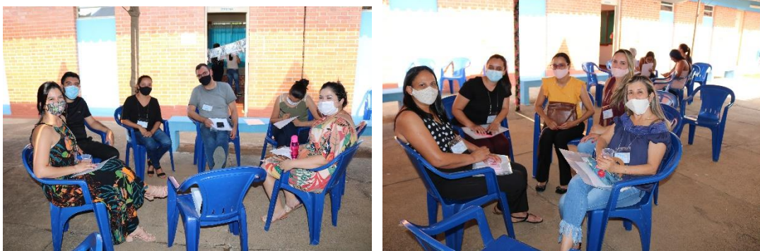
Oficinas com Professores, 21/09/21