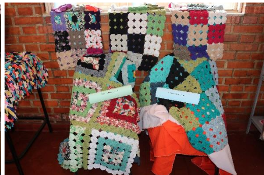
Exposição de Artesanato, 21/09/21, foto: Maria Ap. Campos Rodrigues