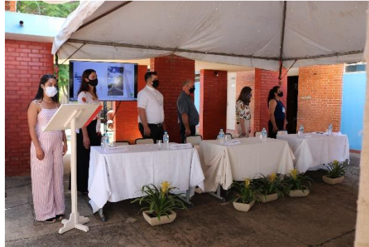
Autoridades, Prefeito, Presidentes dos Conselhos de Patrimônio Cultural e do Conselho Turismo no Encontro Caminhos do Patrimônio Cultural de Serranos, 21/09/21