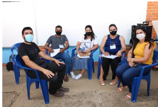
Oficinas com Professores, 21/09/21