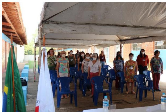
Professores Encontro Caminhos do Patrimônio Cultural de Serranos, 21/09/21, foto: Maria Ap. Campos Rodrigues