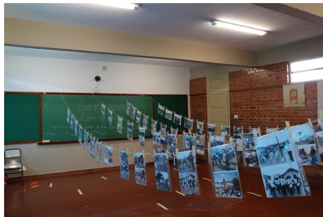
Exposição Fotográfica para conhecimento e pesquisa, 21/09/21, foto: Maria Ap. Campos Rodrigues