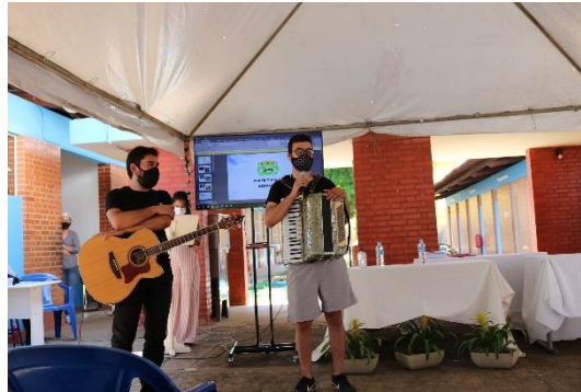
Apresentação Cultural de Violão e Sanfona com artistas de Serranos, 21/09/21, foto: Maria Ap. Campos Rodrigues

Quadro III C – Programas de Educação para o Patrimônio e Ações para Difusão Conjunto Documental III Promoção e Salvaguarda