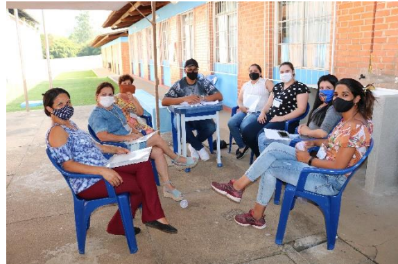
Oficinas com Professores, 21/09/21