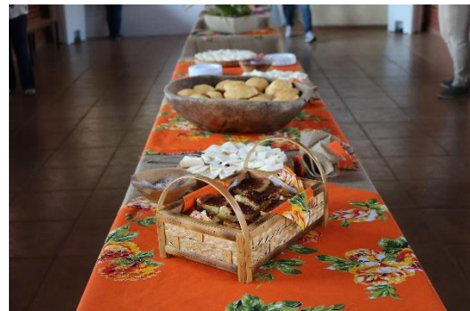
Exposição de Arte Sacra e Café Colonial, 21/09/21